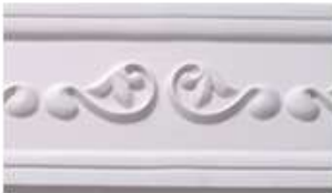
VERONA L 245 cm E 1.5 cm A 12.5 cm