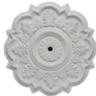
J Nápoles Diámetro 50 cm