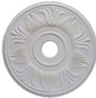
M Génova Diámetro: 50 cm