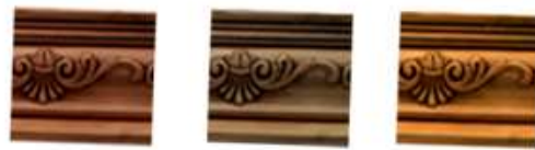
MAPLE MIELLE ROBLE