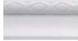
DMI – 5430 L 245 cm E 1.5 cm A 3 cm