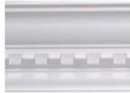
DMI – 8092 L 245 cm E 1.5 cm A 9.2 cm