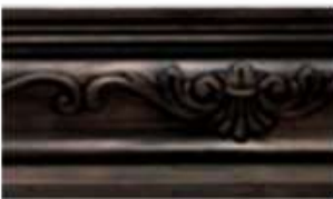
ESCOCIA Cenere L 245 cm E 3 cm A 19.5 cm