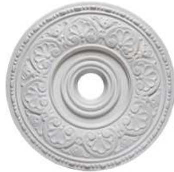
N Parma Diámetro 36 cm