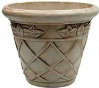
Bologna Color Nogal Americano

Medidas: Diámetro Superior 41 cm Diámetro Inferior 21.5 cm Altura 31.5 cm