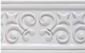
FLORENCIA L 245 cm E 1.5 cm A 12.5 cm