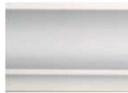
DMI – 12105 L 245 cm E 1.5 cm A 10.5 cm