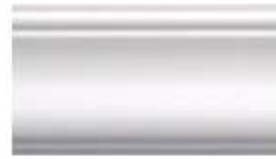
DMI – 1065 L 245 cm E 1.5 cm A 6.5 cm