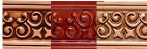
MAPLE CAOBA ROBLE