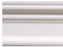
DMI – 1182 L 245 cm x E 1.5 cm A 8.2 cm