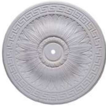
B Bari Diámetro 50 cm