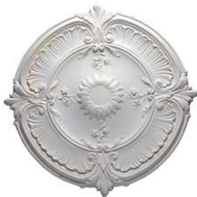
E Roma Diámetro 70 cm