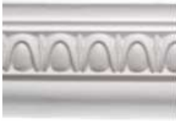
DMI – 82100 L 245 cm E 1.5 cm A 10 cm