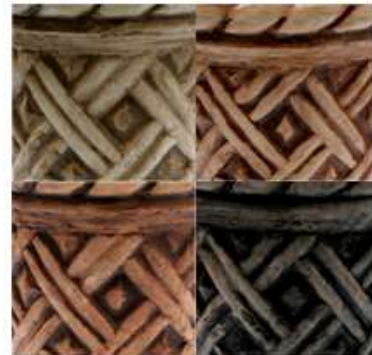
Roble Claro Musgo