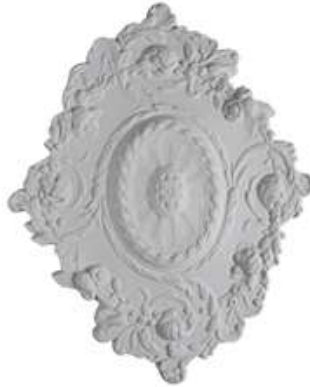
P Milán Diámetro 76 x 60 cm