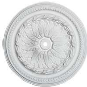
A Imperia Diámetro: 40 cm