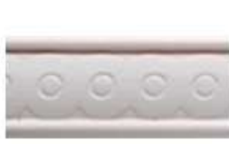
DMI – 5230 L 245 cm E 1.5 cm A 3 cm