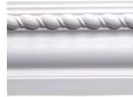
DMI – 8190 L 245 cm E 1.5 cm A 9 cm