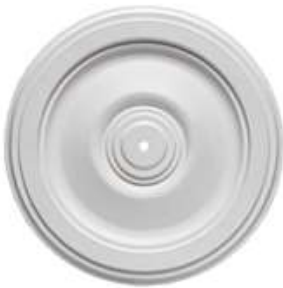
Ñ Turín Diámetro 30 cm